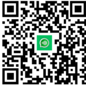
Apple iOS User

Download appen: Søg efter appen "One-Click Translate" i Apple App Store eller Google Play, eller scan den medfølgende QR-kode for at downloade og installere appen.